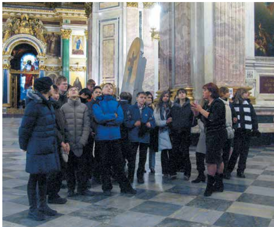
Занятия в рамках проекта «Музей — школе» в Исаакиевском соборе

странства с оснащением новейшим сценическим оборудованием и уникальными музыкальными инструментами. В дни празднования 300-летия Санкт-Петербурга коллектив ГМП «Исаакиевский собор» достойно принял гостей Президента РФ, съехавшихся на приуроченный к юбилею саммит. К этой же круглой дате при не-