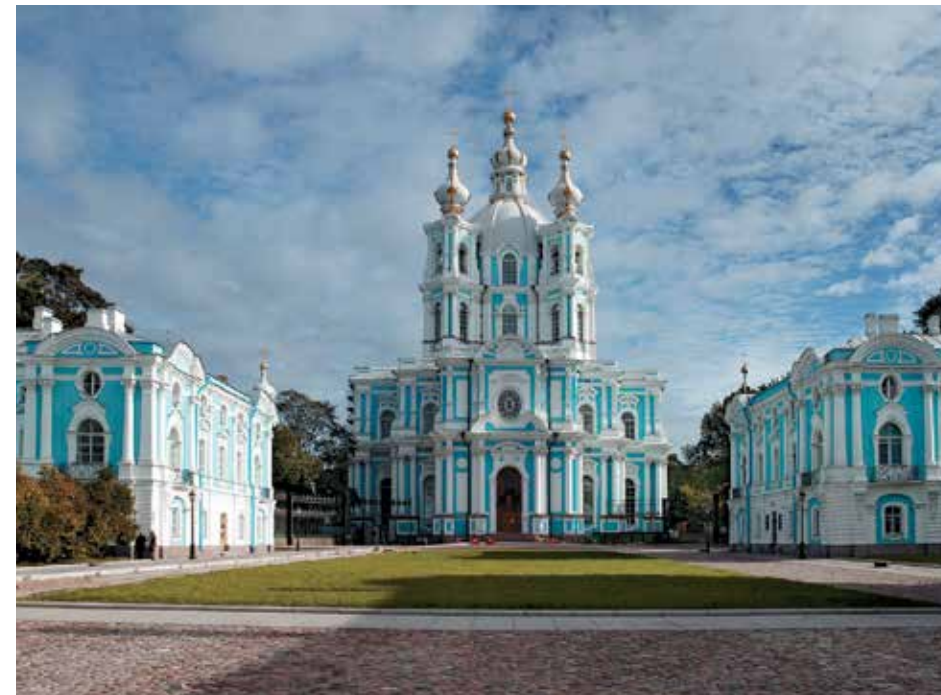
Смольный собор. Существующий вид здания

Несколько десятилетий в здании храма во имя Воскресения Христова всех Учебных заведений располагался Государственный Концертно-выставочный зал «Смольный собор». Объект вошел в состав комплекса позднее остальных — в июне 2004 г. Именно тогда для петербуржцев и гостей Северной столицы было образовано пространство «Музея четырех соборов», до сих пор не имеющего аналогов ни у нас в стране, ни в мире. Решением задач охранно-реставрационного свойства область управленческих приоритетов у Нагорского не ограничивалась. К примеру, в том же Смольном соборе проводились работы по модернизации существующего концертно-зрелищного про-