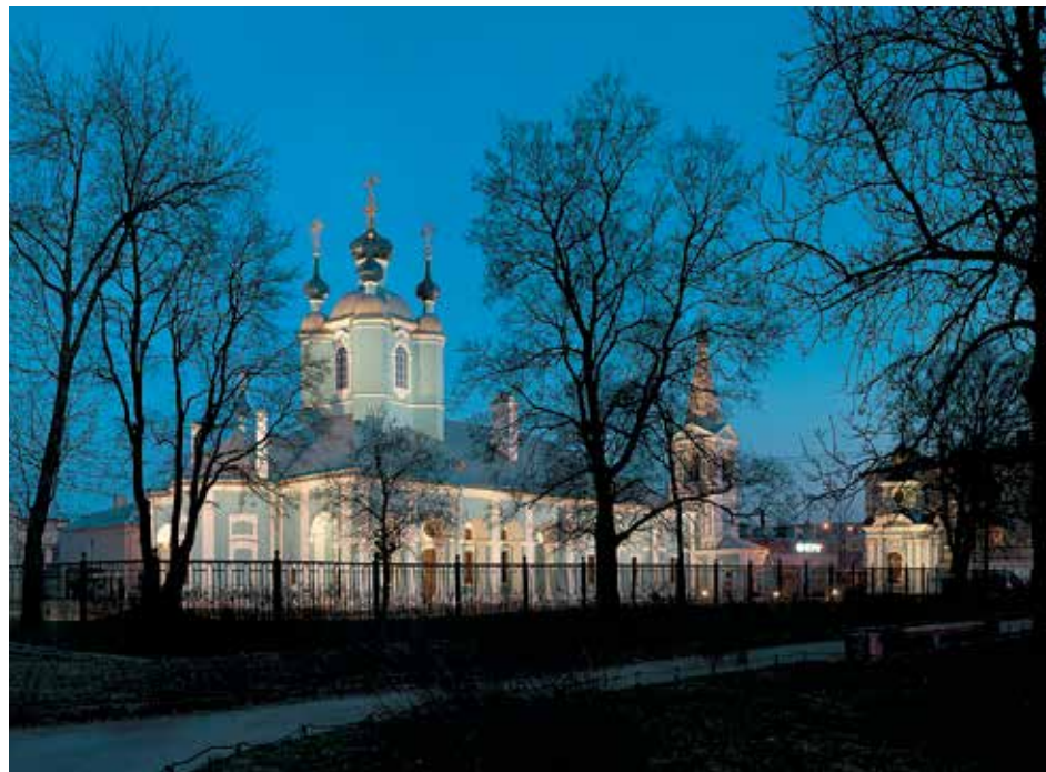
Сампсониевский собор. Существующий вид здания

К этому времени Спас на крови уже много лет находился в аварийном состоянии. Возвращение храму первоначального облика и всех необходимых эксплуатационных характеристик, без которого все планы по его внедрению в музейный оборот оставались не более чем проектами, потребовало колоссальных усилий. По архивам и библиотекам Москвы, Ленинграда, Свердловска ведется кропотливый поиск исторических документов, к обследованию объекта и выполнению проектно-методических разрабо-