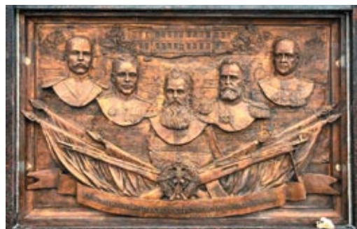
Работы нулевого цикла на строительстве стелы в г. Ломоносове, общий вид готового сооружения и бронзовые барельефы его скульптурной отделки

отличия получила еще пять лет назад, а Выборг и Тихвин — год спустя, то в 2015-м аналогичные мемориальные композиции украсили Кронштадт, Колпино и Ломоносов. Примечательно, что в сооружении трех последних объектов в том или ином качестве принимал непосредственное участие Реставрационный Проектный Научный Центр «Специалист».