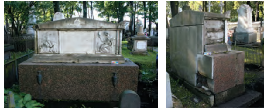
Надгробие графа А. И. Васильева на территории Некрополя XVIII в. до реставрации

Не так давно мастера РМ «Наследие» завершили две очередные, но при этом очень ответственные работы в области сохранения историко-культурного наследия нашего города. Так, на сегодняшний день успешно закончена реставрация надгробия Алексея Васильева, первого министра финансов Российской Империи, из собрания Государственного музея городской скульптуры. Кроме того, восстановлен первоначальный вид модели носового украшения корвета «Витязь» (ростра серьезно пострадала при переводе экспозиции Центрального военно-морского музея из здания Биржи в пространстве Крюковских казарм). О подробностях реализации этих проектов мы попросили рассказать генерального директора мастерской Юрия Щедрова и его заместителя по реставрации Инну Пчелову.