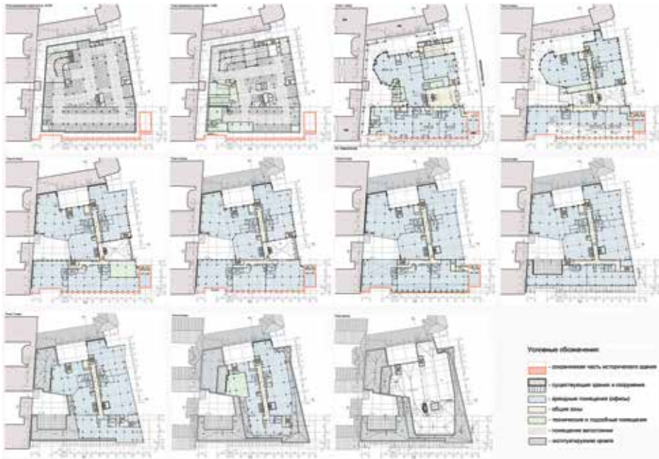
Поэтажные планы здания «Ренессанс-Правда»

Реставрационными разделами, то есть собственно темой сохранения фасада Д. Бурышкина, включая историческую отделку и барельефы, вновь занимались архитекторы ООО «Стройпроект». В № 1-2(43), немалая часть публикаций которого была приурочена к сдаче под ключ комплекса Renaissance Plaza на Литейном, факт успешного сотрудничества этой компании с «Ренессанс Констракшн» уже отмечался на примере спасения быв. фабричной постройки Товарищества ликерного и водочного завода «Иван Ион». Пожалуйста, его очередной пример.