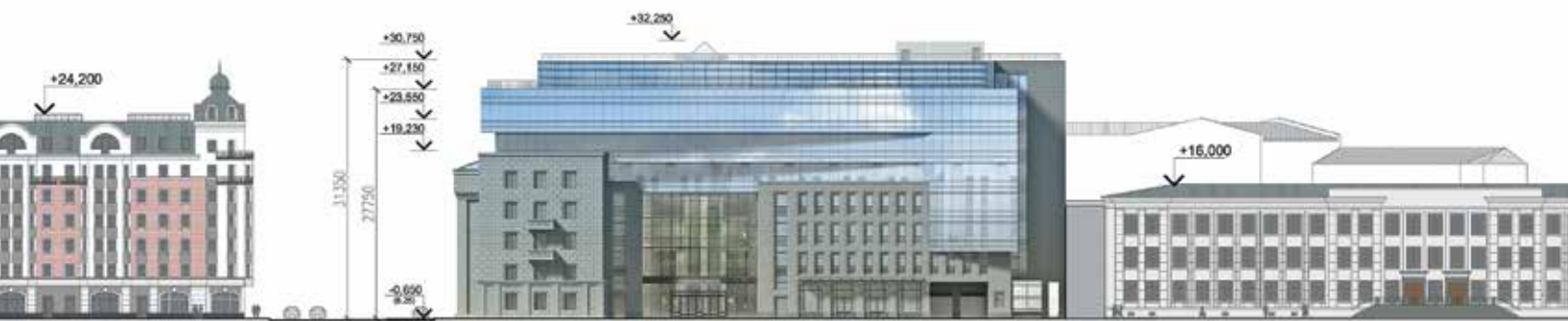
Развертка по ул. Исполкомская