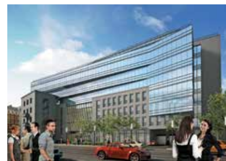
Предварительные варианты колористической трактовки фасадов комплекса (вверху) и их проектные визуализации в окончательно согласованном варианте

предпочли вывезти куда-то в неизвестном направлении.