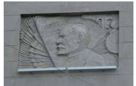
Отреставрированный в ходе реализации проекта барельеф Ленина на сохраняемом фасаде бывшей типографии останется на поминание о любопытной и порой драматичной истории здания

Когда наш заказчик под влиянием активизации градозащитников и их особой нелюбви к стеклу в старой части Петербурга обеспокоился вероятными протестами, мы по его просьбе подготовили несколько альтернативных версий (перфорированные конструкции, традиционно петербургские мотивы и проч.).