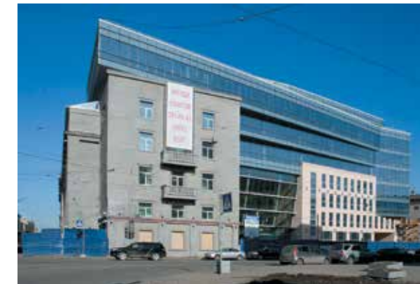
Завершенный строительством БЦ «Ренессанс-Правда» (вверху) и авторские фотофиксации здания на финальной стадии воплощения проекта