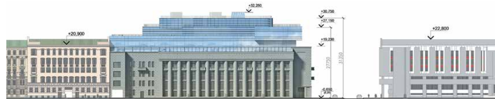
Развертка по ул. Херсонская