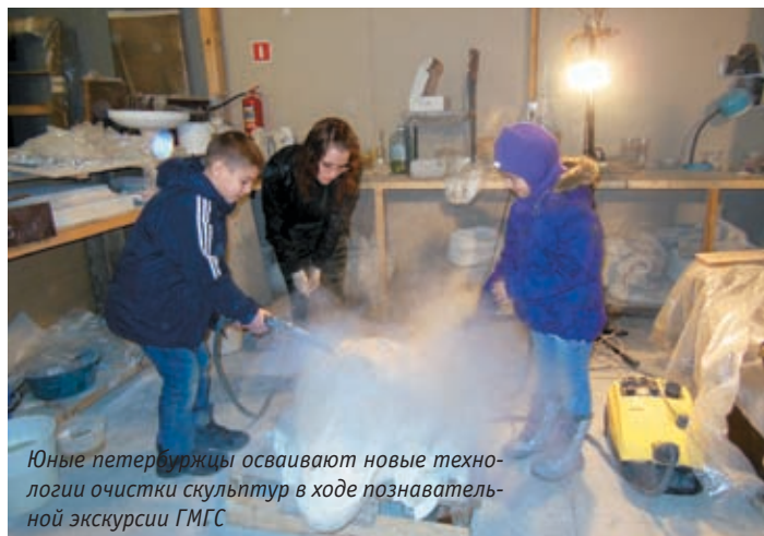
Юные петербуржцы осваивают новые технологии очистки скульптур в ходе познавательной экскурсии ГМГС

Государственный музей городской скульптуры (ГМГС) этой осенью отметил свое 80-летие. Статус его уникален, так как это единственное в России музейное учреждение, занимающееся изучением, охраной и реставрацией памятников монументального искусства в открытой городской среде. В ведении музея свыше 200 таких объектов, плюс 1500 мемориальных досок. 17 и 18 ноября для горожан была организована программа праздничных мероприятий, посвященных юбилею ГМГС. Основной их целью было напомнить жителям города о почетной и важной миссии музея по сохранению художественных и исторических ценностей. Праздничные мероприятия проходили на нескольких музейных площадках. В их числе были организованы интерактивная программа «Секреты реставрации городских памятников» и экскурсии в реставрационные мастерские.