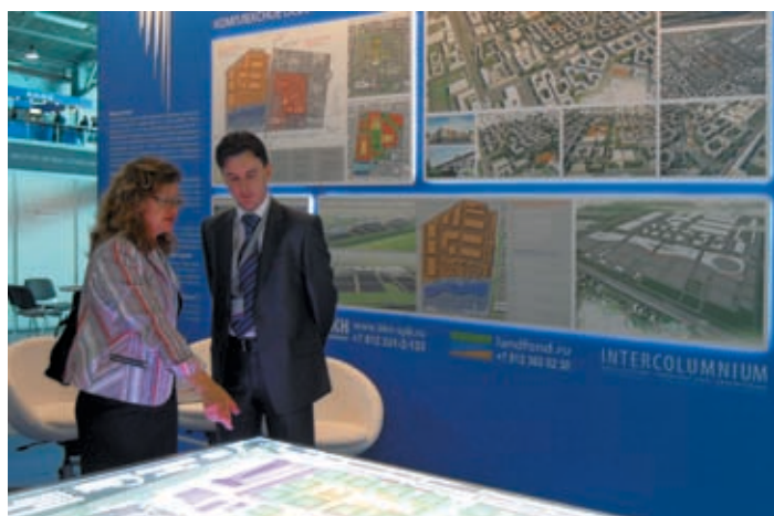
В рамках PROESTATE-2012 на суд профессионалов было вынесено 150 реальных девелоперских проектов, многие из которых успешно воплощаются в Санкт-Петербурге и Ленинградской области

На всем своем протяжении форум успешно использовался как площадка для конструктивного диалога. К примеру, практикующие зодчие могли не однажды обсудить со своими реальными и потенциальными заказчиками самые животрепещущие проблемы градостроительного и архитектурного проектирования. Кульминации это достигло в процессе дискуссии «Архитектура Петербурга: новое враг старого?». Несколько необычным для таких случаев форматом телепрограммы «К барьеру!» (ее в свое время на НТВ вел Владимир Соловьев) взялся дирижировать его коллега с 5 канала Роман Герасимов, неоднократно публиковавшийся как обозреватель «АРДИС». Спор между адептами двух различных подходов