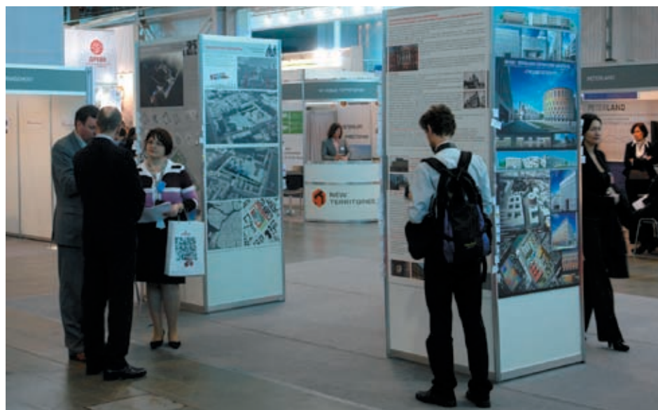
Экспозиция проектов редевелопмента исторической среды, выполненных молодыми архитекторами для конкурса «Петербург: новый взгляд», привлекла большой интерес публики (материал на стр. 30)

Сценарий работы PROEstate-2012 оказался, как всегда, четко продуманным, в силу чего исключительно деловая атмосфера царила на каждом из более чем 40 мероприятий, включенных в программу. Так, Фонд имущества Санкт-Петербурга вновь провел в рамках форума свои традиционные аукционы, выручив в результате более 107 млн. рублей. В свою очередь, Гильдия управляющих и девелоперов не только довела до сведения общественности результаты