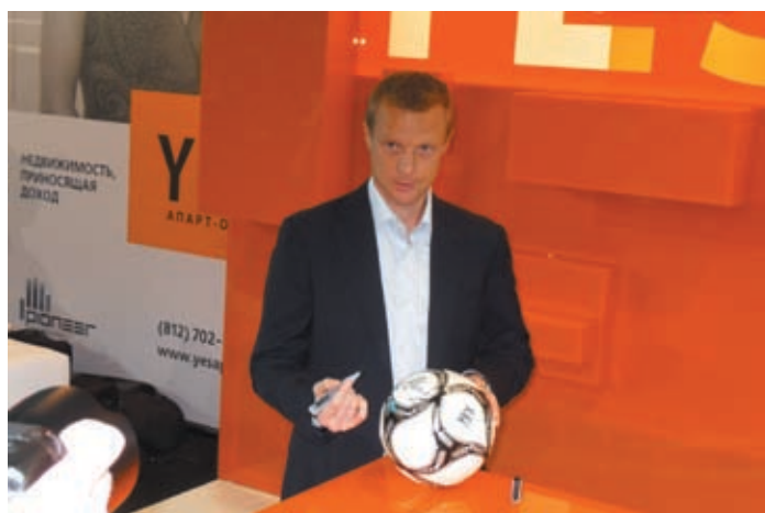
В первый день работы форума легендарный голкипер ФК «Зенит» Вячеслав Малафеев успешно справился с ролью «лица» петербургского проекта Yellow Submarine, или Ye'S