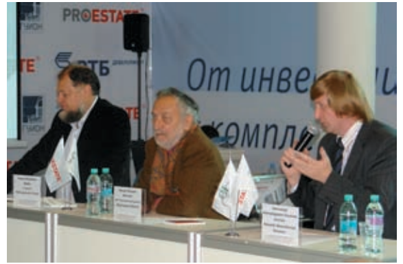
Дискуссия «Архитектура Петербурга: новое враг старого?», проходившая на ProESTATE в формате телепрограммы «К барьеру!», завершилась в обстановке практически полного взаимопонимания условных противников

к вопросам современного градостроительства завершился на удивление мирно, хотя сторонами по ходу дела нет-нет, да и высказывались диаметрально противоположные точки зрения.